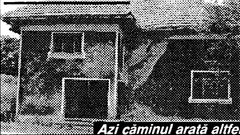
Azi căminul arată altfel