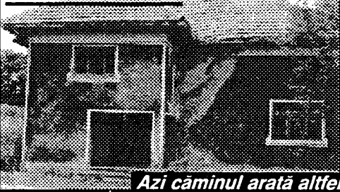
Azi căminul arată altfel